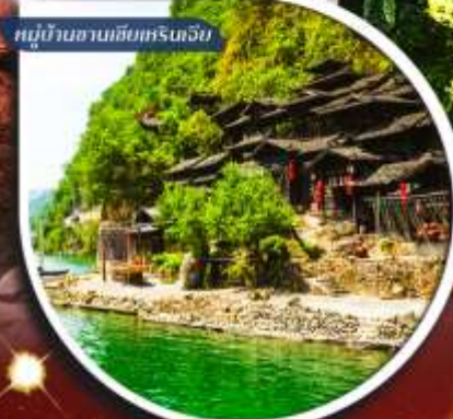
หมู่บ้านชาวนาเขียหรือเจีย