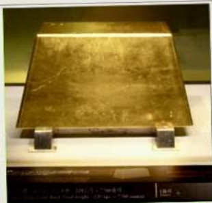
พิพิธภัณฑ์ทองคำ