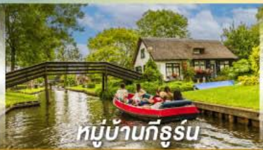
หมู่บ้านทีรูร์น