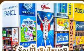
ช้อปปิ้งชินไซบาชิ และโดตงโมริ