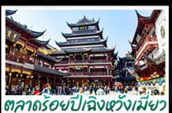
ตลาดร้อยปีเฉิงหวงเมี่ย