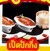
เปิดปิ้งกั๊ง