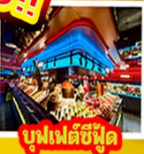
บูฟเฟต์ซีฟู้ด