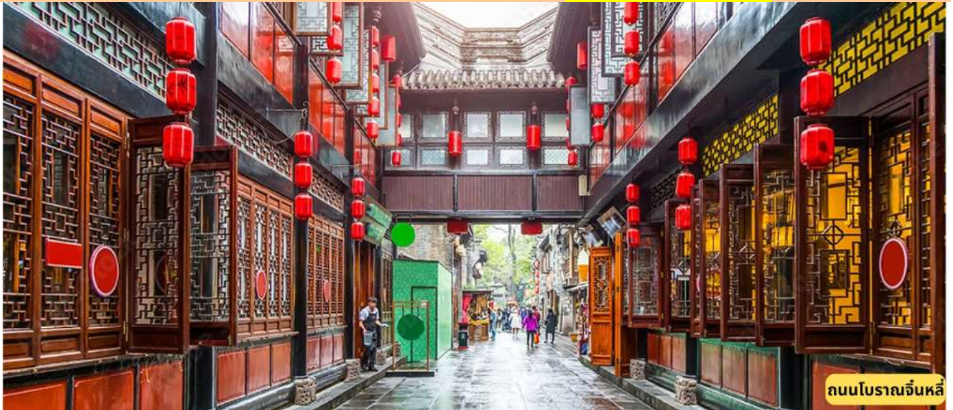
ถนนโบราณจินหลี่

สนามบินสุวรรณภูมิ – เมืองเฉินตู – ถนนโบราณจินหลี่ TG618: 10.15 - 14.25 น.