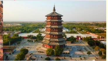
วัดเจดีย์ไม้ มู่ต้า

*ทางบริษัทฯ ขอสงวนสิทธิ์ในการสลับโปรแกรมทัวร์ตามความเหมาะสมขึ้นอยู่กับสถานการณ์หน้างาน โดยคำนึงถึงผลประโยชน์ของลูกค้าเป็นสำคัญ