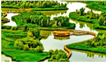
อุทยานพื้นที่ชุ่มน้ำจางเย่