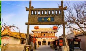
เมืองโบราณตุนหวง