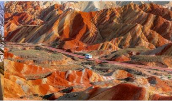
ภูเขาสายรุ้งจางเย่ต้นเสี่ย