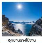
อุทยานดางโป่ซาน