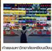
กำแพงมหาวิทยาลัยเหยียนเปียน