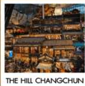
THE HILL CHANGCHUN