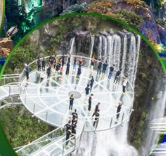
สะพานแก้วคู่หลงเซี่ยะ