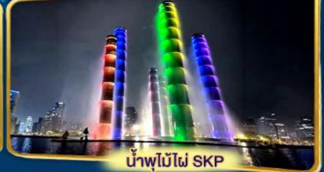
น้ำพุไม้ไฟ SKP