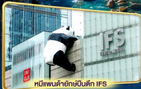
หมีแพนด้ายักษ์ปีนตึก IFS