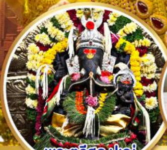
พระตรีศูล ปูณ (Trishul Pune)