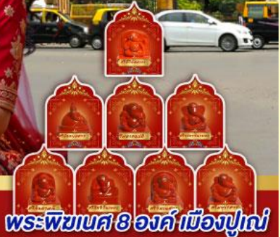
พระพิฆเนศ 8 องค์ เมืองปูณ